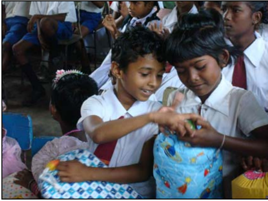
படம் 26 உனது பொதியில் என்ன இருக்கிறது?

சர்வோதய முன்பள்ளி மற்றும் பாலர் பாடசாலையில் கல்வி பயிலும் சிறுவர்களுக்காகவும் யுத்தம் மற்றும் ஏனைய காரணங்களால் இடம்பெயர்ந்து வாழும் சிறார்கள் நிமித்தமும் இந்த சிங்கிதி பரிசு வழங்கப்படுகின்ற அதேவேளை சர்வோதய மாவட்ட நிலையத்தினூடாக இந்த செயற்பாடுகள் மேற்கொள்ளப்படுகின்றன. சர்வோதய முன்பள்ளி செயற்பாடுகளுக்கு இதன் மூலம் உறுதுணையாக அமைந்த அதேவேளை குறித்த சிங்கிதி பரிசு பொதிகளை தயாரித்து இலங்கைக்கு அனுப்பி வைத்த யப்பானிய சிறுவர்களுக்கு இலங்கை சிறார்களின் கைவண்ணங்கள் பரிமாறப்பட்டன. பரிசுப்பொதியில் கற்றல் உபகரணங்கள், விளையாட்டு உபகரணங்கள் போன்றவை உள்ளடக்கப்பட்டிருந்தன.