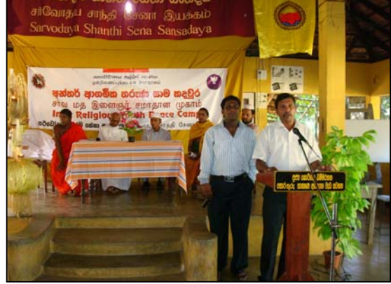
படம்04 ஆரம்ப வைபவத்தின் போது