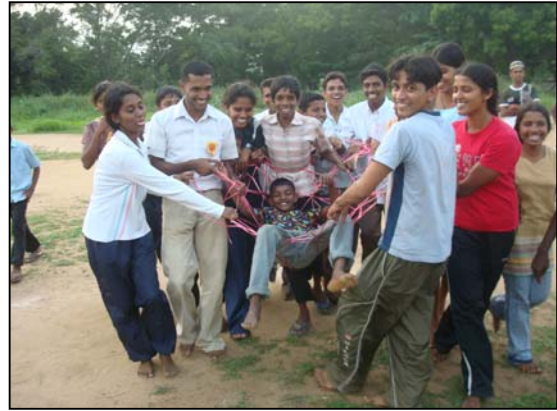
பட்டம் 16 ஒன்றிணைந்து வெற்றிபெறுவோம்