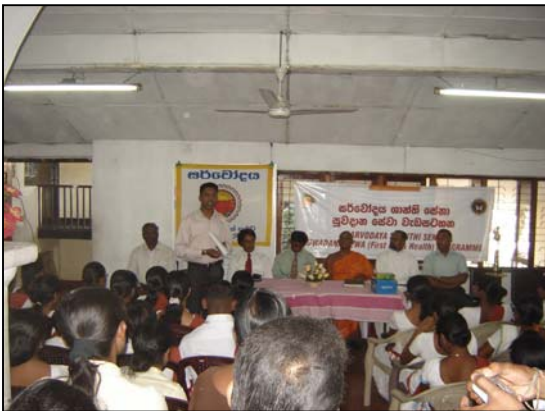
படம் 23 ஒரு நாள் சுகாதார செயலமர்வின் போது