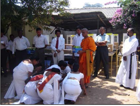
படம் 25 சுவதான சேவையாளர்களுக்கான மருத்துவ உபகரணங்கள் வழங்கும் போது

கிராமிய மக்களுக்கு பரவக்கூடிய மற்றும் ஏனைய நோய்களுக்கான நிவாரணங்களுக்காக சிறந்த சுகாதாரமான சூழ்நிலையொன்றை கிராமிய மட்டத்திலிருந்து ஏற்படுத்துவதற்காகவும் சுவராஜ்ய கிராமத்தை அடிப்படையாக கொண்டு செயற்படும் சுவதான சேவை செயற்றிட்டம் 143 கிராமங்களில் வைத்திய உபகரணங்கள் வழங்குவதுடாக சுகாதார நிலையத்தினை அமைக்கும் செயற்பாடுகளும் நடைபெற்றன. இந்த வைத்திய உபகரணங்கள் மாவட்ட மட்டத்தில் அரச வைத்திய அதிகாரிகளின் பங்குப்பற்றுதலுடன் வழங்கப்பட்டன.