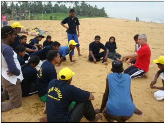
படம் 11 தேசிய சர்வதேச விசேட பயிற்சிகள்

வேலைத்திட்டத்தை ஆரம்பிக்கும் பொருட்டு, வேலைத்திட்டங்களை மேற்கொள்ளவுள்ள கிராமங்களில் ஆய்வுகளை மேற்கொண்டு பொருத்தமான முறைமைகளை அறிமுகப்படுத்தி அதன் வாயிலாக சர்வோதய இயக்கத்தின் இறுதி இலக்கினை எவ்வாறு அடைந்துகொள்வது என்பதை தெளிவுப்படுத்தும் பொருட்டு இப்பயிற்சிகள் வழங்கப்பட்டன. குறித்த பயிற்சியாளர்களுக்கு தேசிய மற்றும் சர்வதேச மட்ட வழிகாட்டல்களின் உதவியோடு தமது திறமையினை எவ்வாறு வளர்த்துக்கொள்வது? என்பது பற்றிய செயலமர்வுகள் நடாத்தப்பட்டதோடு புதிதான முறையில் விளையாட்டை வளர்க்கும் சக்தியும் வழங்கப்பட்டது. இங்கு வேறுப்பட்ட வயதினரையும் இனங்களையும் ஒன்றிணைத்து செய்யப்படும் விளையாட்டு சம்பந்தமாக அதிக கவனம் செலுத்தப்பட்டது. நவீன தொழிநுட்பத்தை பயன்படுத்தி உச்சப்பணை அடைவதற்கான பின்னணியை உருவாக்குவது பற்றியும் பூரண அறிவு வழங்கப்பட்டது.