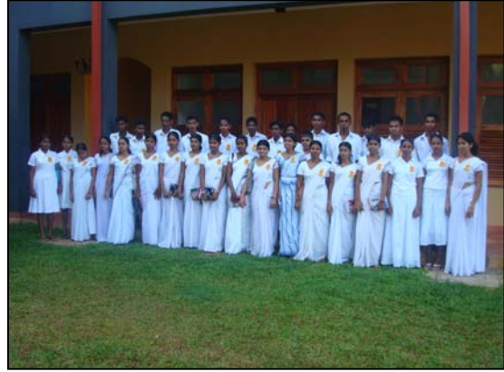
படம் 22 சுவதான சேவையாளர்கள் விடை பெற்றுச் செல்லும் போது