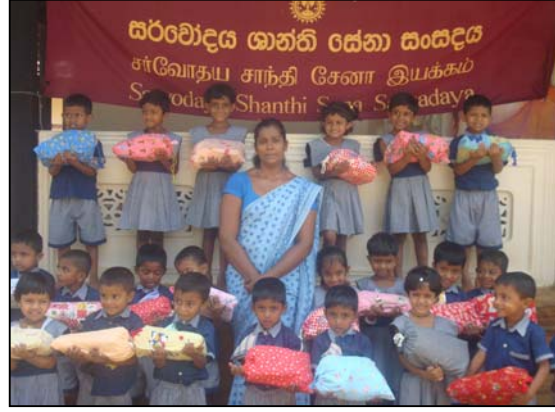
படம் 27 எம் அனைவருக்கும் மிக்க மகிழ்ச்சி