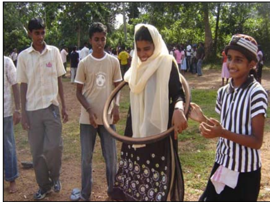
பட்டம் 15 விளையாட்டில் பேதலில்லை