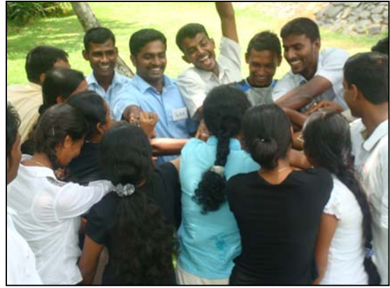
படம் 12 மோதல் தவிர்ப்பு செயன்முறை பயிற்சி