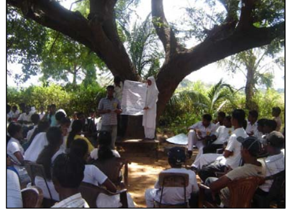
படம் 06 குழுவாக செயற்படல்