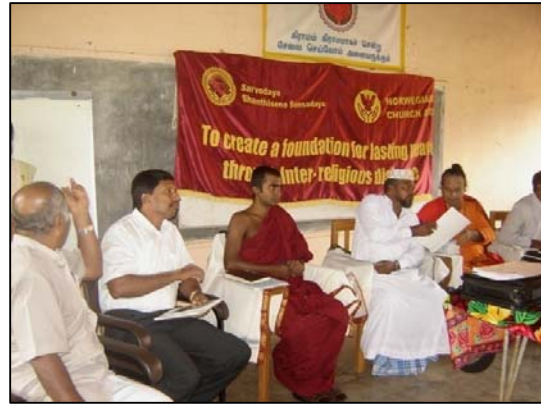
படம் 02 கலந்துரையாடலின் போது