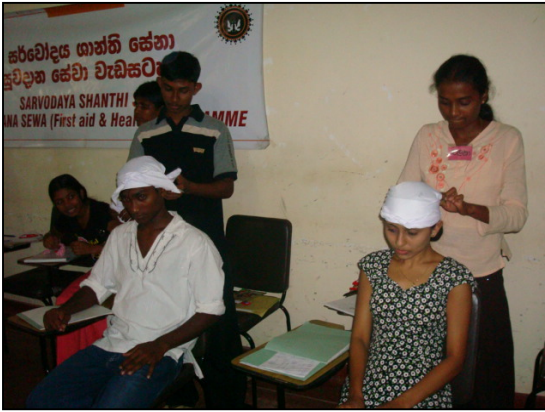
படம் 19 செயன்முறை பயிற்சியின் போது