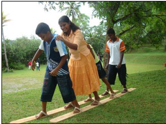
படம் 13 விளையாட்டுகளில் ஈடுபட்டுள்ள அங்கத்தவர்கள்

பயிற்சியாளருக்கான பயிற்சியின் பின் தெரிவு செய்யப்பட்ட கிராமங்களுக்காக பயிற்சியாளர்கள் அனுப்பப்பட்டனர். குறித்த மாவட்டங்களில் உள்ள கிராமங்களில் ஆரம்ப பயிற்சி நடவடிக்கைகள் ஆரம்பிக்கப்பட்டதோடு வேலைத்திட்டமானது மிகவும் அவசியமான ஒரு மாவட்டத்தில் பல்வேறு இன மதங்களை சார்ந்த 03 கிராமங்களை தெரிவு செய்து 09 வயதிற்கும் 19 வயதிற்கும் இடைப்பட்டவர்களை தெரிவு செய்து 03 விளையாட்டு கழகங்கள் அமைக்கப்பட்டன. இவ்வேலைத்திட்டத்தின் மூலமாக வேறுபட்ட இன மத மொழி சார்ந்தவரிடையே அந்நியோன்யம், நட்பு போன்றவற்றை வளர்க்கும் நிகழ்ச்சித்திட்டங்கள் செயற்படுத்தப்பட்டதோடு அவர்களது திறமைமையும் வளர்த்து கொள்ள முடிந்தது. நிலவுகின்ற யுத்த சூழ்நிலைகளுக்கு மத்தியில் பல்வேறுபட்ட இனங்களை சார்ந்தவர்கள் இதில் பங்குபற்றியதோடு இதன் மூலமாக அவர்கள் பெற்றுக்கொண்ட அனுபவமானது அவர்களது எண்ணங்களில் மாற்றத்தை ஏற்படுத்தும் என எதிர்பார்த்ததோடு பெற்றோர், பெரியோர்களிடையில் புரிந்துணர்வு ஏற்படுத்தும் என ஏனைய ஆய்வு நிறுவனங்களில் கணிப்பில் குறிப்பிடப்பட்டிருந்தது.