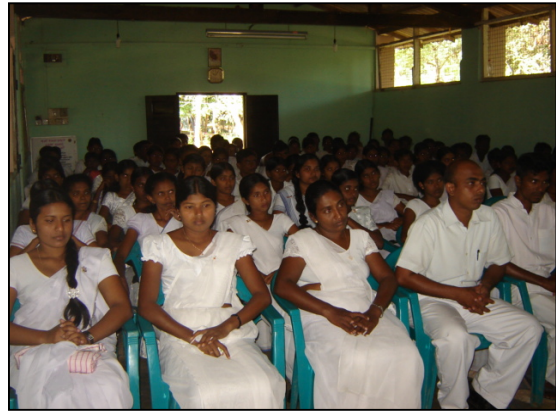
படம் 24 எதிர் காலத்திடை குறித்து தெளிவுபடுத்துகையில்