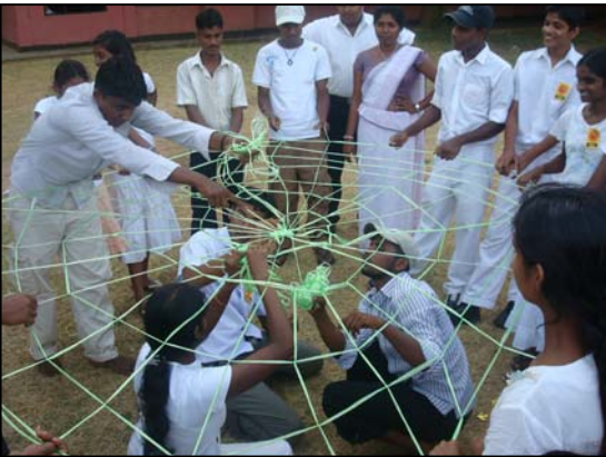
படம் 07 நாமாணவரும் ஒரு வலையின் கீழ்