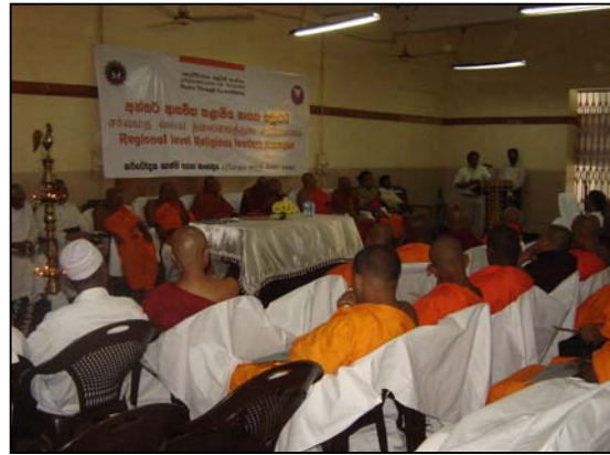
படம் 10 தென் பிராந்திய சமய சம்மேளனம்