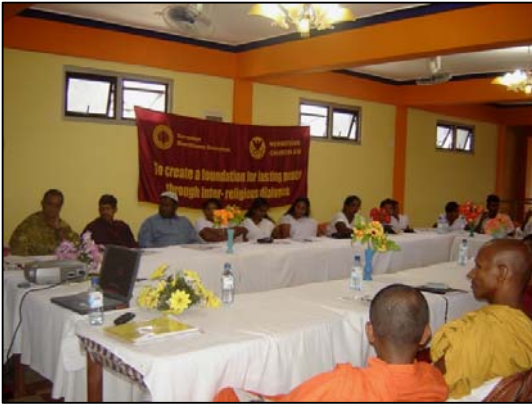
படம் 01 நாட்டிற்கு தேவையானவற்றை வெளிப்படுத்தல்

சாந்தி சேனாவின் மோதல் தடுப்பு மற்றும் தலைமைத்துவ பயிற்சி பெறும் இளம் தலைவர்கள் தமது கிராமங்களிலே ஆரம்பித்துள்ள சாந்தி சேனா இளைஞர் பிரிவினாடாக மேற்கொள்ளப்படுகின்ற வேலைத்திட்டங்களுக்காக மத தலைவர்களினதும் சமூக தலைவர்களினதும் ஒத்துழைப்பினை பெற்றுக்கொள்ளும் பொருட்டு மாவட்ட மட்டத்தில் சகவாழ்வை விருத்தி செய்வதற்கு தேவையான மக்கள் ஒத்துழைப்பையும், விசுவாசத்தையும் ஏற்படுத்தும் பொருட்டு அவசியமான செயற்பாடுகளை மேற்கொள்ளுவதற்காக இச்செயற்றிட்டம் ஏற்பாடுசெய்யப்பட்டுள்ளது. விஷேடமாக வேலைத்திட்டங்களை தொடர்ந்து மேற்கொள்வதற்காகவும் தேசிய ஒருமைப்பாட்டு அமைப்பினை ஏற்படுத்தி வேலைத்திட்டங்களுக்கான பங்களிப்பினை பெற்றுக்கொள்வதும் இதன் எதிர்பார்ப்பாகும். அந்தந்த மாவட்டங்களில் மேற்கொள்ளப்பட்ட சகல வேலைத்திட்டங்களிலும் சமய தலைவர்களின் ஆசிரவாதத்தையும், ஒத்துழைப்பையும் பெற்றுக் கொள்ளக் கூடியதாக விருந்தது.