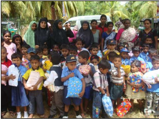
படம் 28 சிறுவர்களுக்கு பேதமில்லை