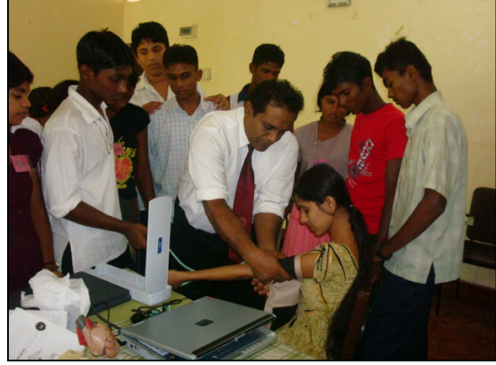
படம் 18 வைத்தியர்களால் பயிற்சி அளித்தல்