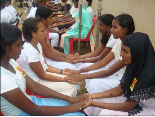
படம் 05 நாமாணவரும் ஒன்றிணைவோம்