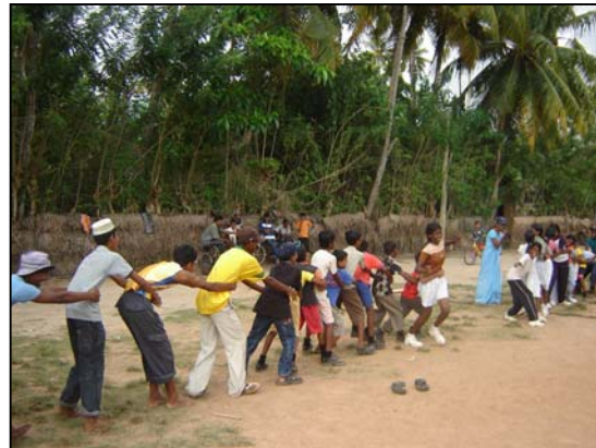
படம் 14 நாங்கள் ஒரே கிராமத்தையும் தேசத்தையும் சேர்ந்தவர்கள்