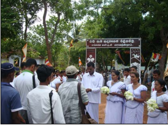
படம் 03 வட சொந்தங்களை வரவேற்றல்