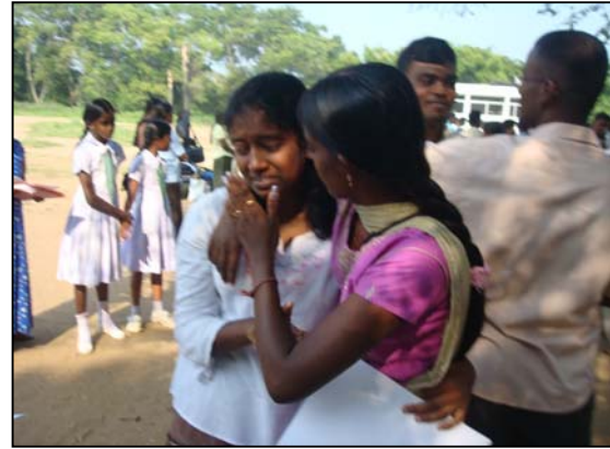
படம் 08 போய் வருகிறேன் -விடை பெறுதல்