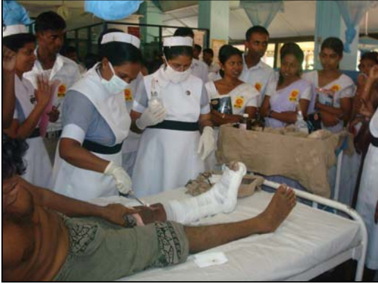
படம் 17 வைத்திய சாலையில் பயிற்சி பெறும் போது