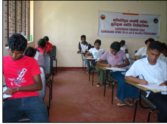
படம் 20 எழுத்து பரீட்சையின் போது