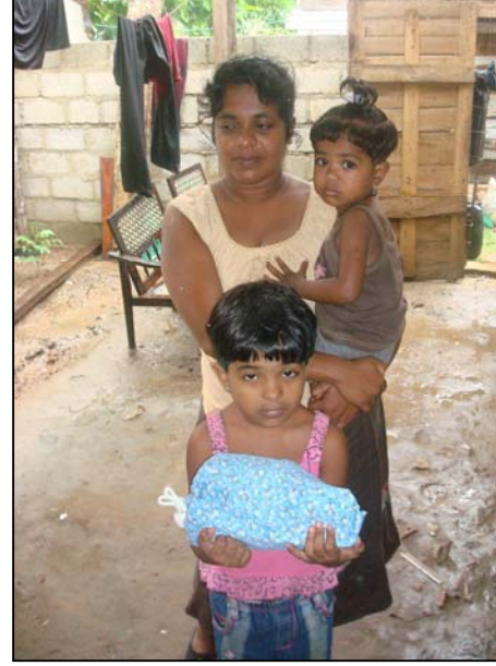
படம் 30 தங்கைக்கும் எனக்கும் இது போதுமானது