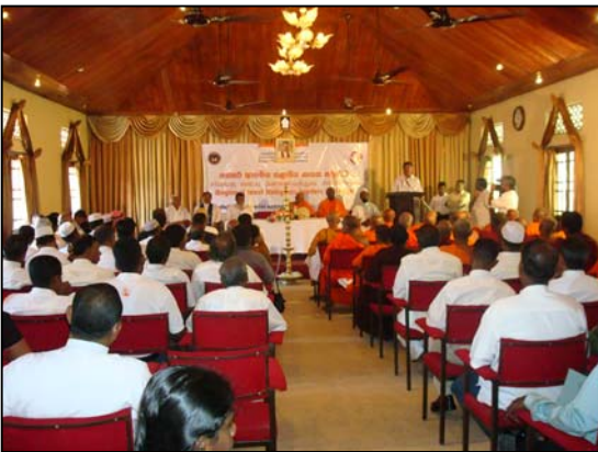
படம் 09 கண்டி ஆளுநர் மாளிகை- வலய மட்டகூட்டம்