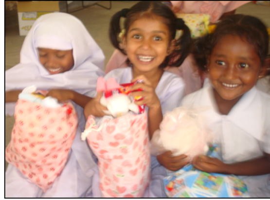
படம் 29 சிறுமிகள் சிரித்த முகங்களோடு