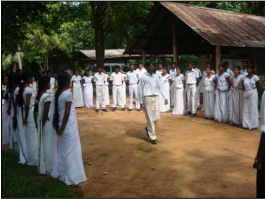
படம் 21 சுகாதார சான்றிதழ் பெறும்போது